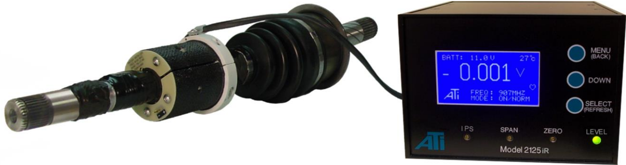
ドライブシャフト用小型デジタルトランスミッター取り付け分割カラー 及び 2125iR デジタル レシーバー